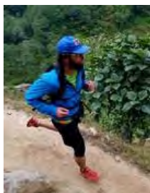
Zoom 100 Millas Himalaya

Durante cinco días, los participantes han recorrido unos 160 kilómetros, con etapas de 21 a 42 kilómetros, por la cordillera del Himalaya.