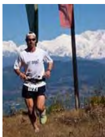
Zoom 100 Millas Himalaya

Santamaría ha dominado la carrera desde la primera de las cinco etapas, y ha sido el más rápido en todas ellas consiguiendo un crono final de 15 horas 22 minutos, 1 hora 55 minutos por delante del inglés James Anthony Lowe.